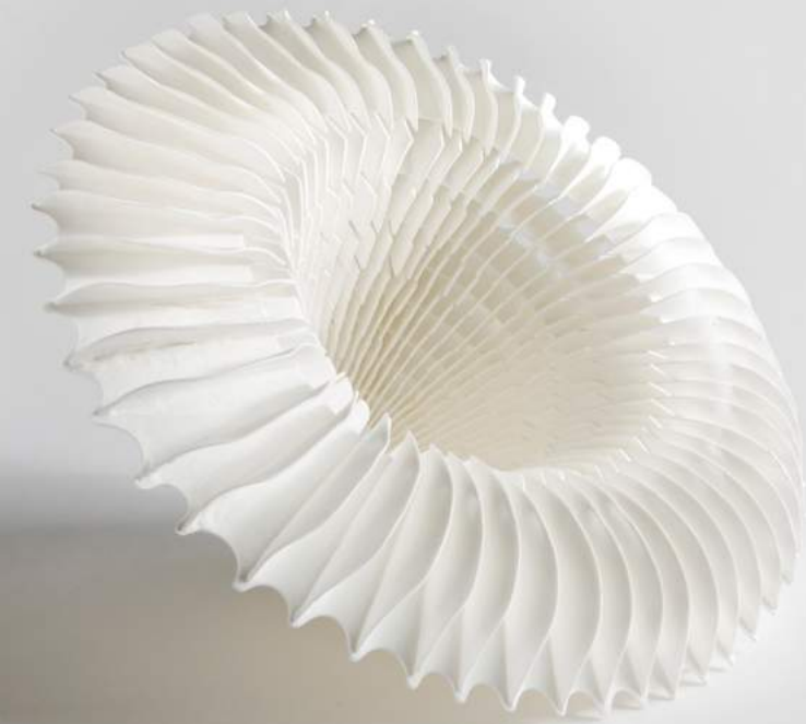
Maria Pohlkemper »bloom« Porzellanobjekt · 2019 www.pohlkemper.de