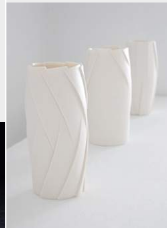
Lotte Schlör »inbetween« Porzellanobjekt · 2019 www.lotte-schloer.de