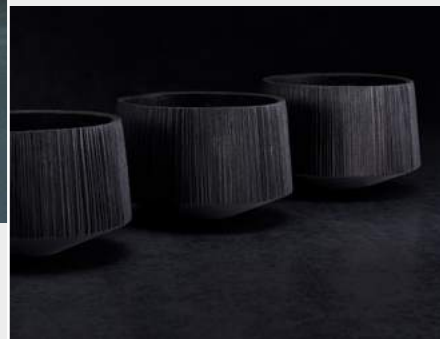
Sebastian Hepp ohne Titel geschmiedete Gefäßgruppe www.sebastianhepp.com