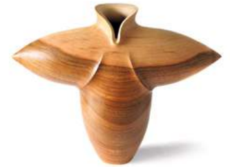
Peter Hromek »Kleiner Himmel« Holzobjekt · 2020 www.salzundpfeffermuehlen.de