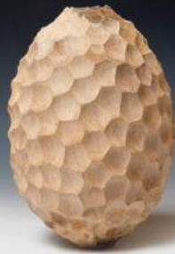
Klaus Kirchner »Facettenobjekt #646« Holzobjekt · 2021 www.klauskirchner.net