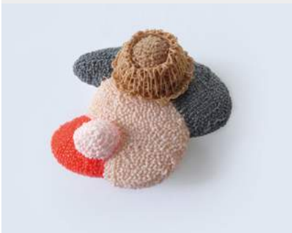
Unk Kraus »öhn pöh düh poh 1« Brosche · 2021 www.unkraus.eu