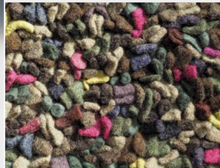
Ute Ketelhake »Waldboden« Teppich · 2021 www.secondliferugs.com