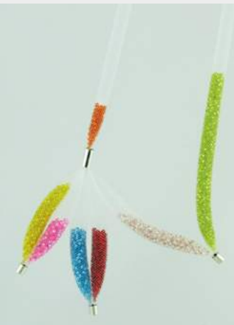
Annamarie Matzakow »Frühling am Bosphorus« Kette · 2019 www.matzakow.de