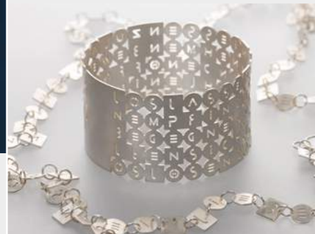
Silvia Bunke ohne Titel Armreif und Buchstabenkette · 2020 www.schmuckundtexte.de