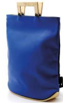
Karen Häcker »HYDROGEN X 0020« Recycling-Rucksack · 2021 www.industrielerlikt.com