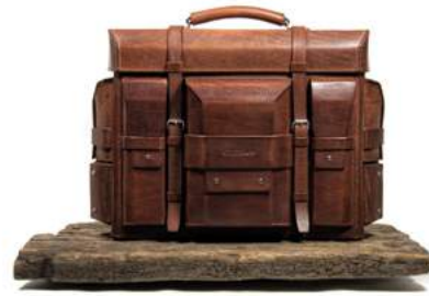
Ulrich Czerny »S3« Koffer · 2022 www.lederdesign.de