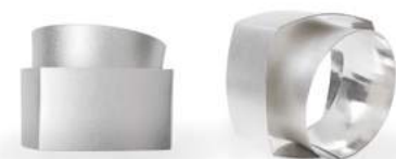
Marit Bindernagel »KONVERGENZ« Armreif · 2020 www.atelierbindernagel.de