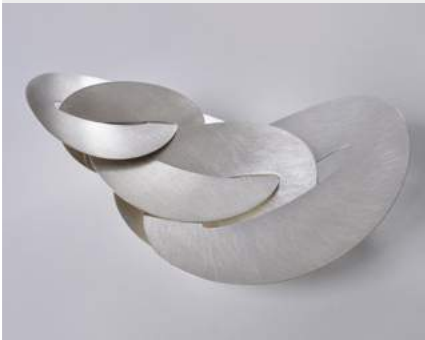
Sabine Braunfisch »g.plus/facetto« Ring · 2019 www.braunfisch.de