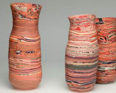
Dorothee Wenz ohne Titel Porzellangefäße · 2020 www.dorothee-wenz.de