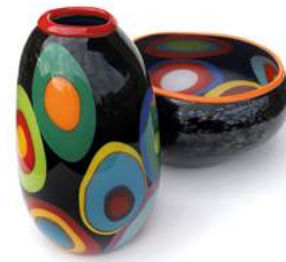
Simone Fezer »Hommage à Niki I & II« Schalenobjekte · 2020/21 www.simonefezer.com