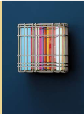
Michael Berger »KWO FP-V1« kinetisches Wandobjekt · 2020 www.atelier-berger.de